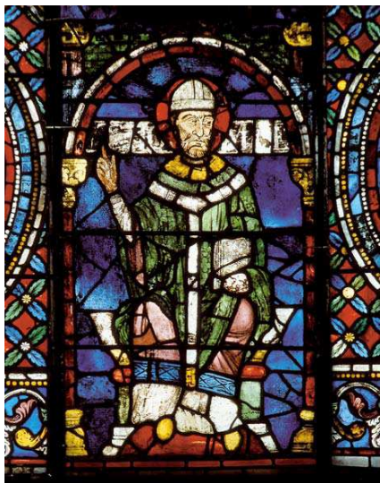
Fig. 2. Vidriera de una catedral gótica.

Estas creaciones contenían verdaderos programas iconográficos.