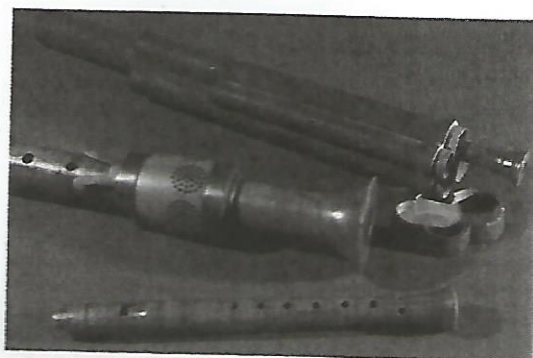
Figura 2.6. Conjunto de flautas.