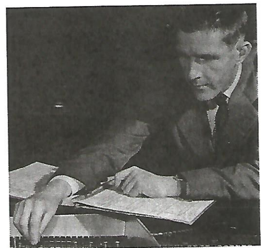
Figura 6.8. John Cage.

En la web encontrarás ampliada la información sobre la vida y obra de John Cage.